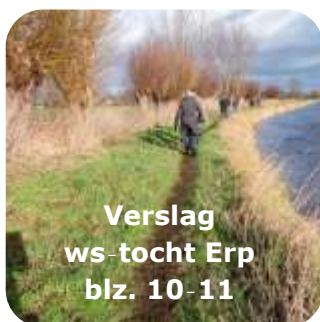
Verslag ws-tocht Erp blz. 10-11