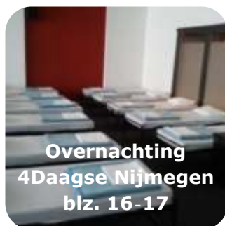
Overnachting 4Daagse Nijmegen blz. 16-17