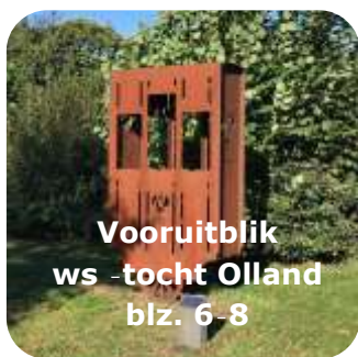
Vooruitblik ws-tocht Olland blz. 6-8