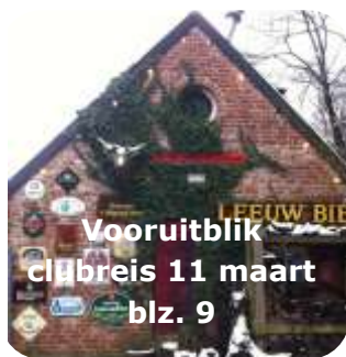
Vooruitblik clubreis 11 maart blz. 9